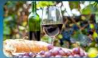
พิเศษ!! ซิมไวน์ท้องถิ่น