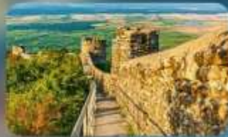
กำแพงเมืองโบราณซิกนาทึ