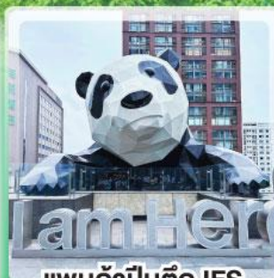
แพนด้าป็นตึก IFS