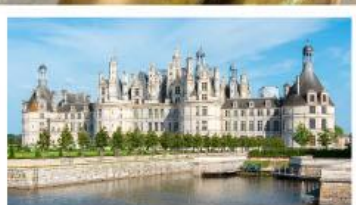
เข้าชมพระราชวังซ็องบอร์