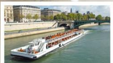
ล่องเรือแม่น้ำแชนน์