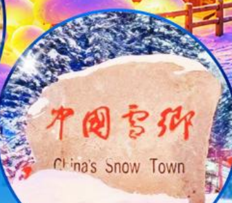
ป้ายหินใหญ่เมืองหิมะ