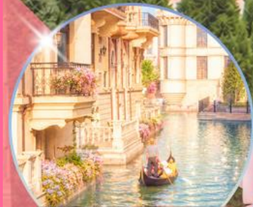
เวนิส เมืองต้าเหลียน