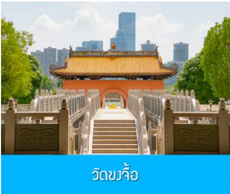
วัดขงจื้อ

เช้า บริการอาหารเช้า ณ ร้านอาหารในโรงแรม (8)