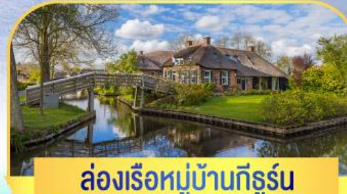
ล่องเรือหมู่บ้านทีรูรัน