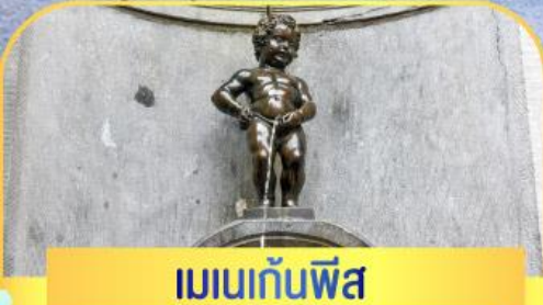
เบนกันพิส