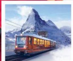
รถไฟเขาคอนเนอร์เกรต