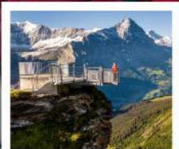
กรีนเดลวาลด์เฟียส