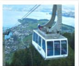
ขึ้นกระเช้ายอดเขาริกิ