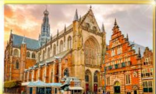
จัตุรัสเมืองฮาร์ลิม

ชมแคนเมืองแปลกเนเธอร์แลนด์และเบลเยียม เดินเมืองเคลฟท์ เมืองเครื่องปั้นดินเผาระดับโลก ฮาร์ลิมเมืองมั่งคั่งที่สุดของเนเธอร์แลนด์