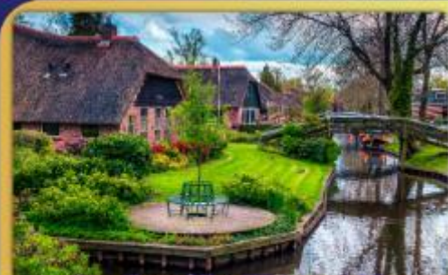
ล่องเรือหมู่บ้านไรกันนทีธูร์น