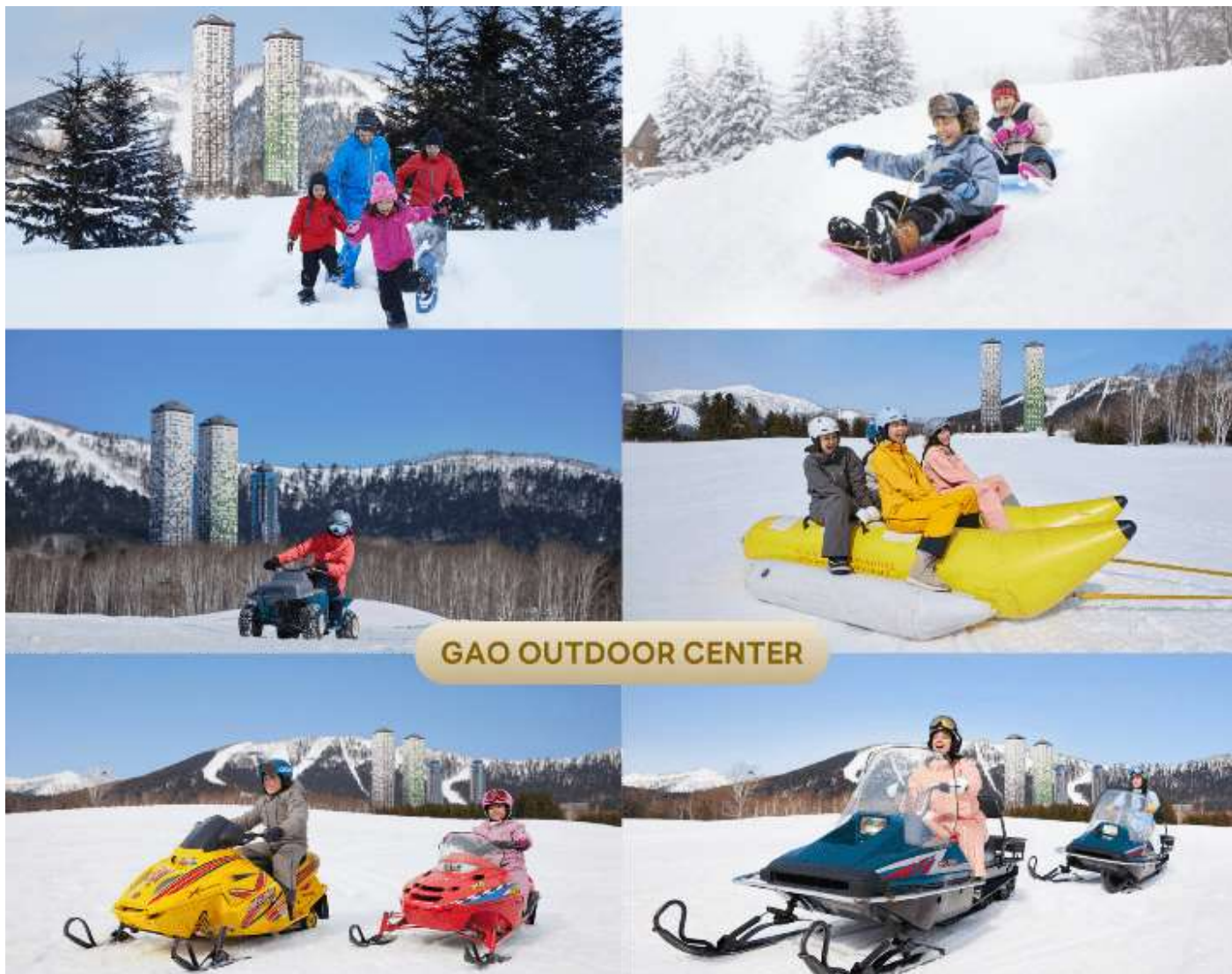
GAO OUTDOOR CENTER

นำท่านสู่ โฮชิโนะริสอร์ทโทมามุ (Hoshino Resort Tomamu) ให้ท่านได้สนุกสนานไปกับกิจกรรมทางทิมะ ณ GAO OUTDOOR CENTER กิจกรรมที่มีบริการอยู่ไม่ว่าจะเป็น Snow Raft เรือยางขนาดใหญ่ที่สามารถนั่งเป็นกลุ่ม หรือเดี่ยว ไหลลงจากเนินตามเนินเขาที่กำหนด และยังมี Banana Boat ซึ่งลากด้วยสโนว์โมบิลไปตามทางซิกแซกสันเนินสร้างความสนุกสนานตื่นเต้นได้มากเลยทีเดียว และ Sled สำหรับพาหนะส่วนตัวที่ไหลลงจากเนินสูง ตื่นเต้นเร้าใจไปกับการขี่ SNOW MOBILE เรียกได้ว่าคนจะเป็นมือใหม่หรือโปรก็ต้องสนุกไปกับการเล่นสกีของที่นี่แน่นอน (ราคาทัวร์ไม่รวมค่าเช่าชุดกันหนาว และอุปกรณ์การเล่น)