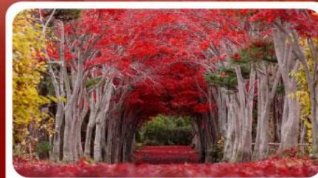
สวนลับชิราโอกะ