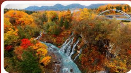
น้ำตกชิราฮิเกะ