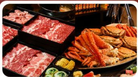
บุฟเฟ่ต์ชาบู ยาปู 3 ชนิด