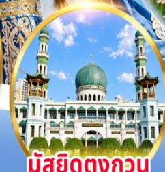
มัสยิดตงกอน