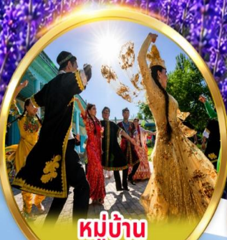
หมู่บ้าน วัฒนธรรมอูยกูร์