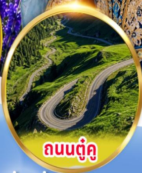
ถนนตุ๋นคู