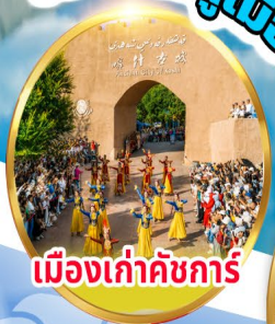
เมืองเก่าคัชการ์