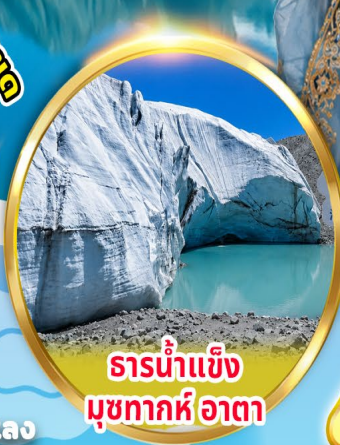
ธารน้ำแข็ง มุขทากห์อาตา