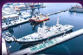
เรือตัดน้ำแข็งเลนิน