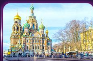
โบสถ์แห่งหยดเลือด