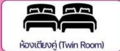
ห้องเตียงคู่ (Twin Room)