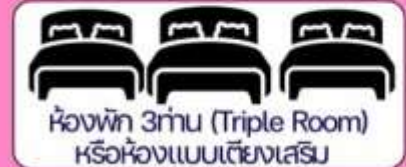
ห้องพัก 3 ท่าน (Triple Room) หรือห้องแบบเตียงเสริม

กรณีพัก 3 ท่านถ้าวันที่เข้าพักโรงแรม ไม่มีห้อง TRP (3 ท่าน) อาจจำเป็นต้องแยกพัก 2 ห้อง (มีค่าใช้จ่ายพักเดี่ยวเพิ่ม) กรณีห้อง TWIN BED (เตียงเดี่ยว 2 เตียง) ซึ่งโรงแรมไม่มีหรือเต็ม ทางบริษัทขอปรับเป็นห้อง DOUBLE BED แทนโดยมีต้องแจ้งให้ทราบล่วงหน้า หรือ หากต้องการห้องพักแบบ DOUBLE BED (1 เตียงใหญ่) ซึ่งโรงแรมไม่มีหรือเต็ม ทางบริษัทขอปรับเป็นห้อง TWIN BED แทนโดยมีต้องแจ้งให้ทราบล่วงหน้า กรณีห้องพักในเมืองที่ระบุไว้ในโปรแกรมมีเทศกาลวันหยุดยาว มีงานประชุมหรืองานแฟร์ต่างๆ บริษัทขอจัดที่พักในเมืองใกล้เคียงแทน