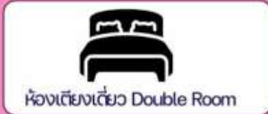
ห้องเตียงเดี่ยว Double Room