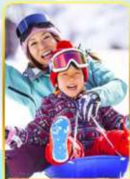
กิจกรรมลานสกีฟูจิ