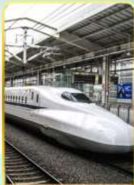
ทดลองนั่งชินคันเซน