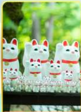
วัดโกโตคุจิ(วัดแมว)