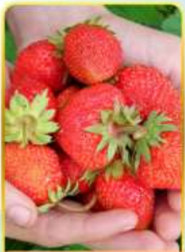
กิจกรรมเก็บสตอเบอรี่