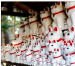
วัดโตโตคุจิ(วัดแมว)