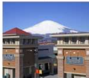
โกเท็มมะเจ้าท์เค็ต