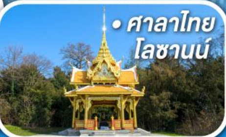
• ศาลาไทย โลซานน์