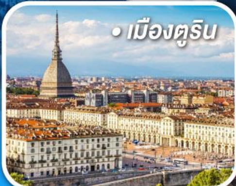
• เมืองตูริน