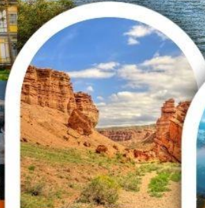
ซารินแคนยอน