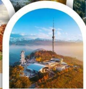
จุดชมวิวเขาค็อกโกเบ