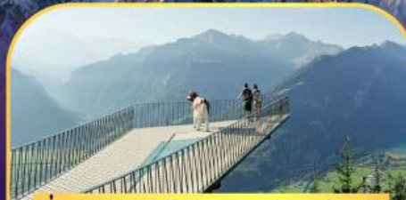
นั่งรถกระเช้าไฟฟ้า ฮาร์เตอร์ คูล์ม