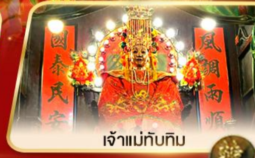
เจ้าแม่ทับทิม