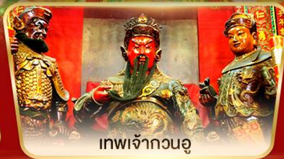
เทพเจ้ากวนอู