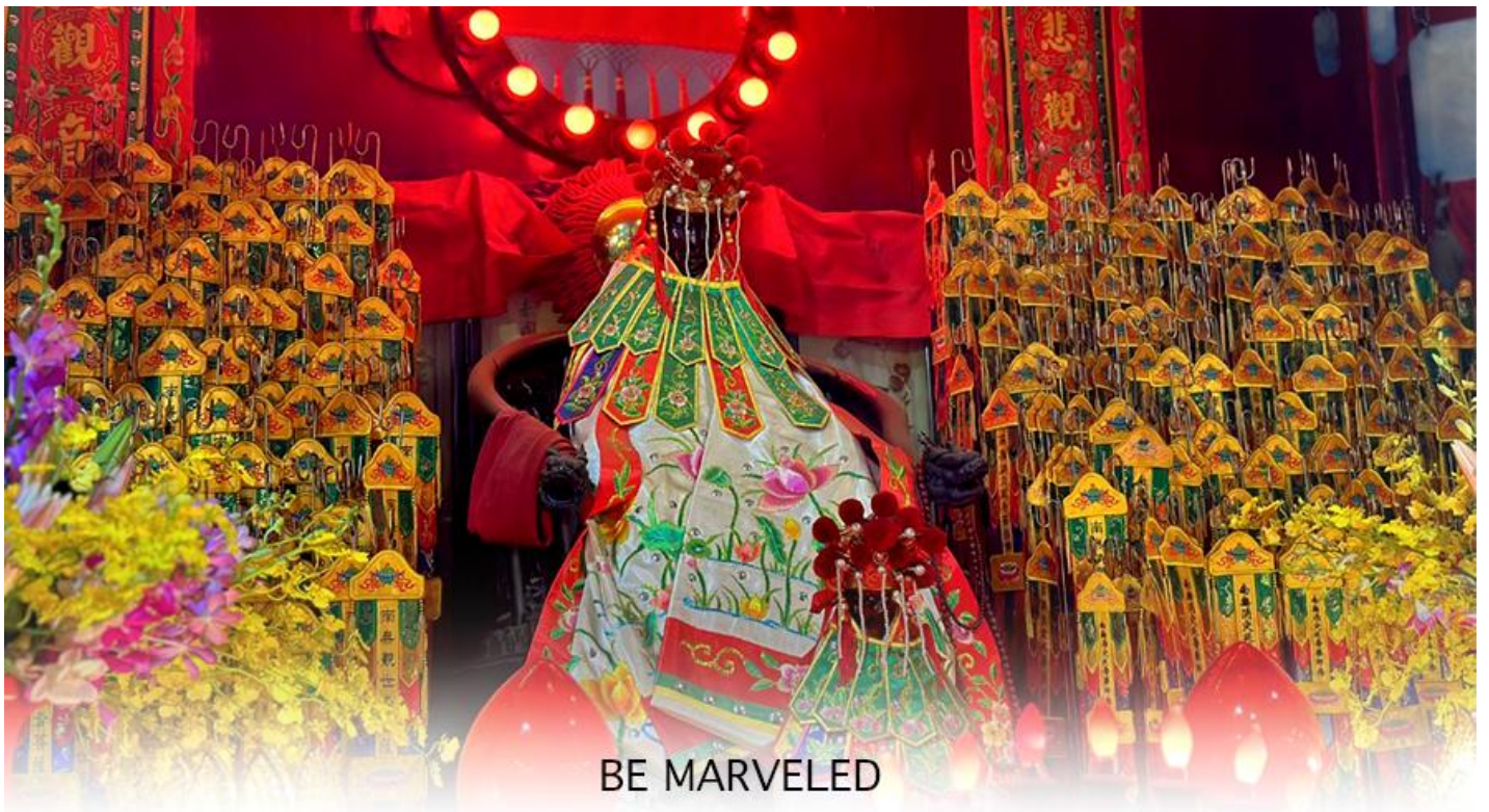
BE MARVELED วัดเจ้าแม่กวนอิมฮองอำ (ยิมนิน)

ให้เดินทางกลับไปกราบไหว้ และขอบคุณเจ้าแม่กวนอิมอีกครั้ง โดยเตรียมชุดไหว้และกระดาษเงินกระดาษทอง ที่เป็นเหมือนเงินที่เรานำมาคืน เป็นการไหว้เพื่อคืนเงินเจ้าแม่กวนอิมนั่นเอง