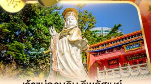
เจ้าแม่กวนอิม ธิพลสมัย