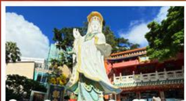
เจ้าแม่กวนอิมรัฟัสเบย์