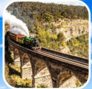
ZIG ZAG RAILWAY