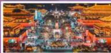
ถนนวัฒนธรรมราชวงศ์ถัง