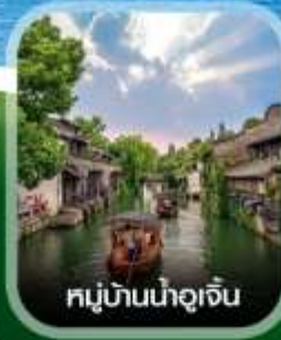
หมู่บ้านน้ำจู้เจิน