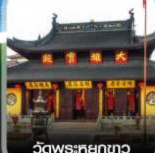
วัดพระศรีกษชาว