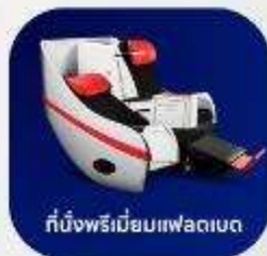
ที่นั่งพรีเมียมแพลาเซนต์