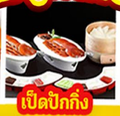
เปิดปิ้งกั๊ง