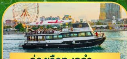
ล่องเรือทะเลดำ