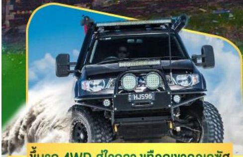
คันรถ 4WD สู้อีกกลางเทือกเขาคอเคซัส