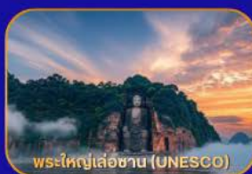
พระใหญ่เล่อซาน (UNESCO)

ล่องเรือชม "พระใหญ่เล่อซาน" - เมืองโบราณหวงหลงซี - แพนด้าเซลฟี่ - ห้างสรรพสินค้า - Wangjianglou Park - ถนนชุนซีลู่ (แหล่งช้อปปิ้ง) - IFS (แพนด้าปีนตึก) - วัดต้าเจี๋ย