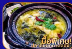
มีอพิเศษ! ปลาต้มผักกาดดอง