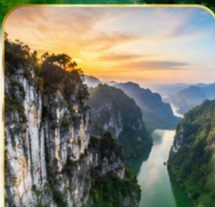
ล่องเรือ หมาเหยียนเหอ