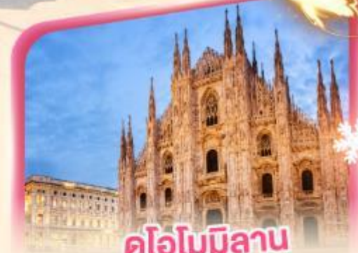
คูโอโมมิลาโน