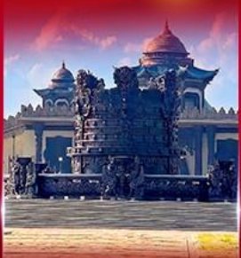
ศูนย์วัฒนธรรม มองโกเลีย หยวนหลิว