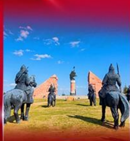
สวนสาธารณะเจงกิสข่าน