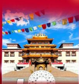
วัดพระโพธิสัตว์ ดูลาน