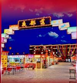
ตลาดกลางคืน ทาลาเดอซี