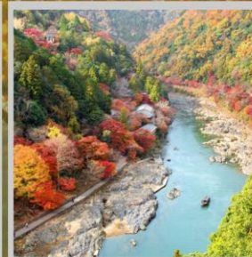
"ARASHIYAMA MT. KAMEYAMA"