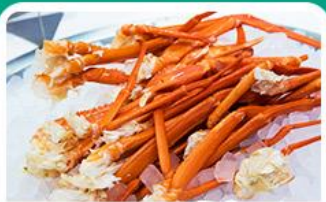
พิเศษ! บุฟเฟ่ต์จากรัฐ