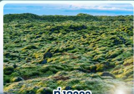
ทุ่งลาวา