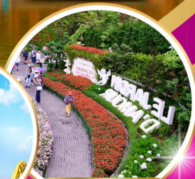
Le Jardin d'Amour