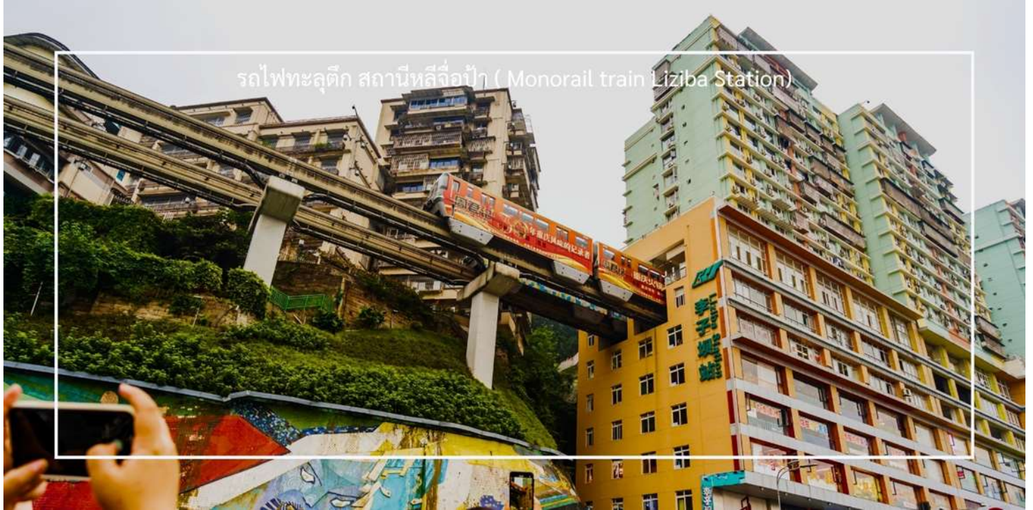
รถไฟฟ้าลูตึก สถานีหลี่จื่อเป้า (Monorail train Liziba Station)

ถ่ายภาพโมเมนต์สุดล้ำนี้จากมุมต่างๆ ของเมือง จุดชมวิวนี้ไม่เพียงสร้างความตื่นตาตื่นใจ แต่ยังเป็นสัญลักษณ์ของการผสมผสานระหว่างเมืองสมัยใหม่กับภูมิประเทศที่มีภูเขาและแม่น้ำรายล้อม