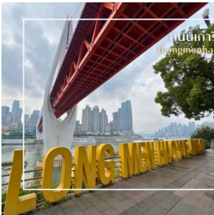
ถนนเก่าริมแม่น้ำ (Longmenhao Old Street)

นำท่านสู่ ถนนโบราณหลงเหมินฮ่าว (Longmenhao Old Street) ถนนเก่าริมแม่น้ำอีกหนึ่งแลนด์มาร์กสำคัญของเมืองฉงชิ่ง ถนนสายนี้เคยเป็นย่านการค้าและศูนย์กลางเศรษฐกิจที่รุ่งเรืองในยุคราชวงศ์หมิงและชิง ปัจจุบันได้รับการอนุรักษ์ไว้อย่างดี เพื่อเป็นแหล่งเรียนรู้ทางประวัติศาสตร์ และแหล่งท่องเที่ยวเชิงวัฒนธรรมที่เต็มไปด้วยเสน่ห์บรรยากาศของถนนยังคงอบอวลไปด้วยกลิ่นอายวันวาน อาคารบ้านเรือนแบบโบราณผสมผสานกับร้านค้า ร้านอาหาร และแกลเลอรีร่วมสมัยอย่างลงตัว อีกทั้งยังเป็นจุดชมวิวแม่น้ำที่โดดเด่น สามารถมองเห็นสะพานข้ามแม่น้ำแยงซีและทัศนียภาพของเมืองฉงชิ่งในมุมที่สวยงาม และอีกหนึ่งจุดหมายที่สะท้อนเสน่ห์ดั้งเดิมของที่นี่คือ Xiahaoli Old Street ตรอกซอกซอยแคบ ๆ บันไดหิน และสถาปัตยกรรมไม้โบราณที่ยังคงกลิ่นอายของวิถีชีวิตในอดีต แม้ในปัจจุบันจะได้รับการบูรณะและพัฒนาให้เหมาะกับการท่องเที่ยว ก็ยังคงรักษาบรรยากาศคลาสสิกเอาไว้ได้อย่างดี