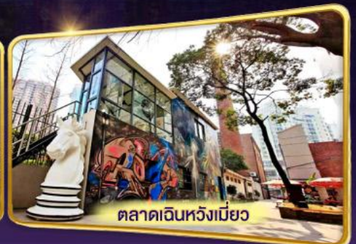
ตลาดเงินหวังเมี่ยว