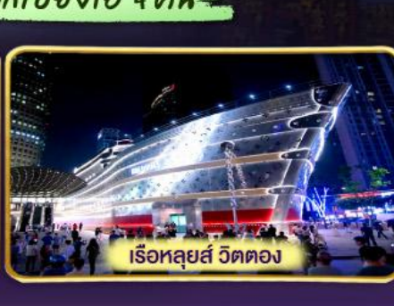
เรือหลุยส์ วัดตอง