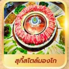
สุกใสโตลมองโก