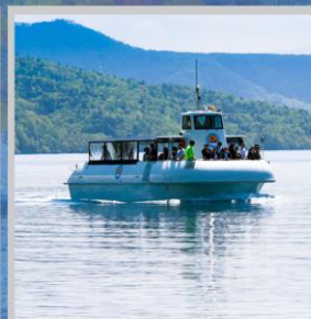
"LAKE SHIKOTSU GLASS BOAT"