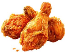
● ไม่ทานสัตว์ปีก (ไก่)