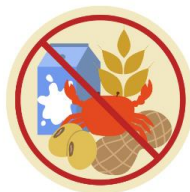
● แพ้อาหาร / อื่นๆโปรดระบุ