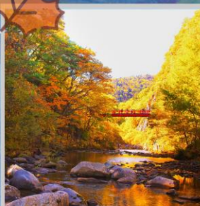
"JOZANKEI FUTAMI BRIDGE"