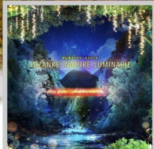
“JOZANKEI NATURE LUMINARIE”