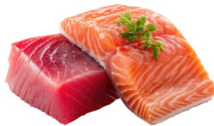
● ไม่ทานปลาดิบ