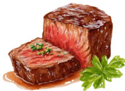
● ไม่ทานเนื้อวัว

ขอความกรุณาแจ้งวัตถุประสงค์ที่ท่าน แพ้หรือไม่สามารถรับประทานได้