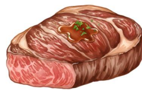
● ไม่ทานเนื้อหมู