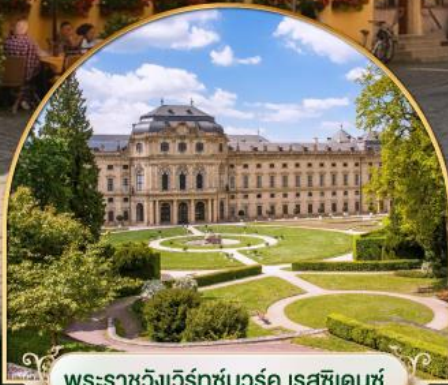
พระราชวังแวร์ซายส์ ฝรั่งเศส