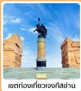
เขตท่องเที่ยวเจงกิสข่าน