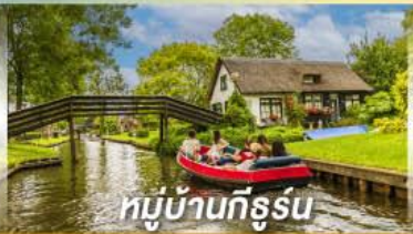
หมู่บ้านทีรูร์น