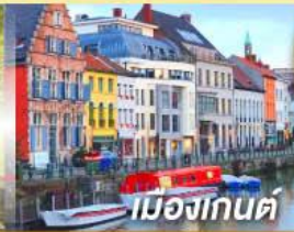
เมืองกันต์