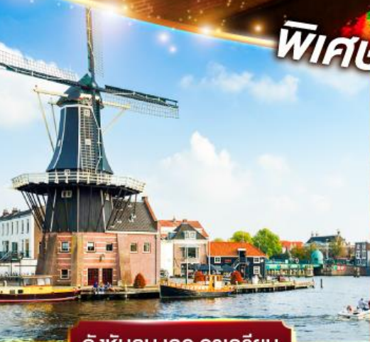
กังหันลม เดอ อาครियิน