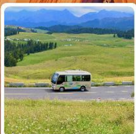
ทุ่งหญ้าเจียนปูลาเค่อ