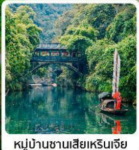
หมู่บ้านซานเสี่ยเหรินเจีย