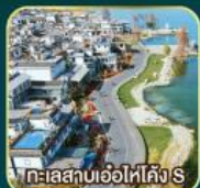
ทะเลสาบเก้าหัวมังกร