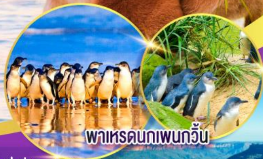
พาเหรดนกเพนกวิน