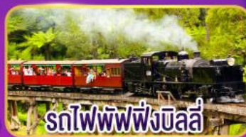
รถไฟพัพฟิงบิลลี่