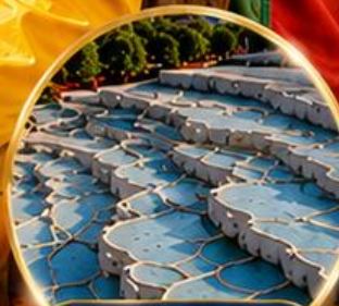
ปามุกคาล่า Pamukkale