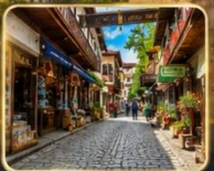
เดินเล่นย่านเมืองเก่าบรรยากาศย้อนยุค