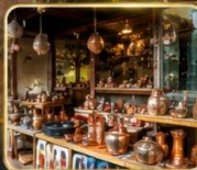
เลือกซื้อของฝากงานหัตถกรรมพื้นเมือง