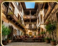
บ้านเรือนสไตล์ออตโตมัน อายุกว่า 200 ปี

เมืองท่องเที่ยวที่มีชื่อเสียงของจังหวัดการาบิก (Karabük) ในปี 1994 เมืองซาฟรานโบลู ได้ถูกองค์การยูเนสโกยกให้เป็นมรดกโลกทางด้านวัฒนธรรม