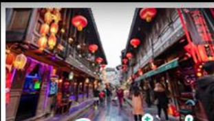
ถนนโบราณจิ้นหลี่