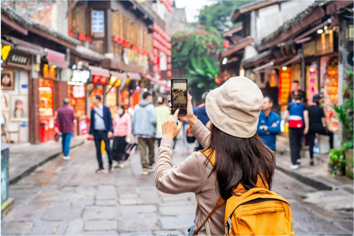
กลางวัน บริการอาหารกลางวัน ณ ภัตตาคารอาหารพื้นเมือง

จากนั้นนำท่านเดินทางสู่ หมู่บ้านโบราณฉือไซ่ว (Ciqikou Ancient Town) เป็นหมู่บ้านอนุรักษ์ ทางวัฒนธรรม และเป็นสถานที่ท่องเที่ยวชื่อดังของมหานครฉงชิ่ง ลักษณะก็คล้ายๆ กับตลาดเก่าหรือตลาดโบราณบ้านเรา สำหรับคนที่อยากไปย้อนเวลากลับไปในอดีตก็ต้องไปเยือน เพราะที่นี่ยังคงรักษาวิถีชีวิต รวมทั้งสะท้อนรากเหง้าดั้งเดิมของเมืองไว้ได้อย่างดีเยี่ยม ไม่ว่าจะเป็นตึกรามบ้านช่องที่มีรูปทรงโบราณ แหล่งผลิตสินค้า และอาหารพื้นเมืองที่สืบทอดกิจการต่อกันมาหลายรุ่น