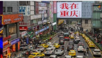
กวนอิมเจียว

*ทางบริษัทฯ ขอสงวนสิทธิ์ในการสลับโปรแกรมทัวร์ตามความเหมาะสมขึ้นอยู่กับสถานการณ์หน้างาน โดยคำนึงถึงผลประโยชน์ของลูกค้าเป็นสำคัญ